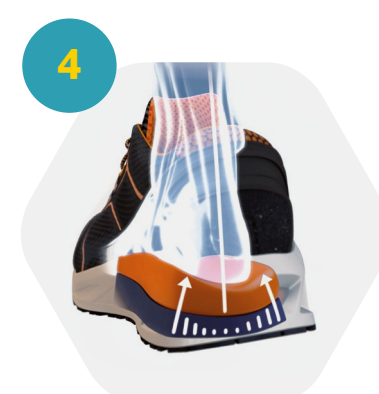
Estabilización del pie