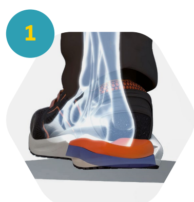
Amortiguación de movimiento

K-POP está diseñado para garantizar un confort dinámico, gracias al sistema patentado de geometría variable i-daptive® , que cambia de posición según el trabajo y el tipo de terreno.